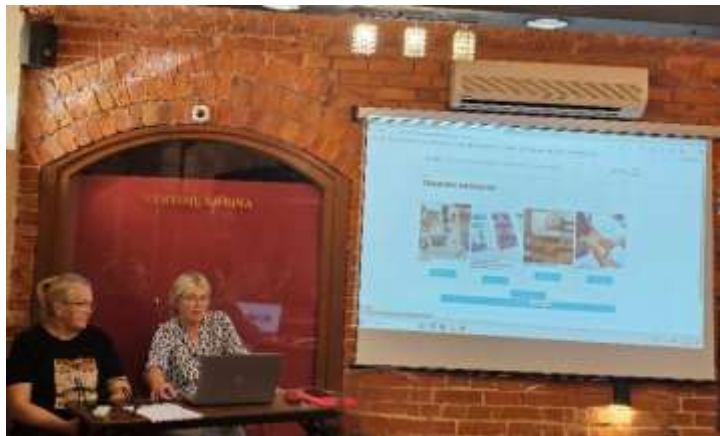
Sklaidos renginys Lietuvoje, Socialinių inovacijų fondas, birželio 21 d.

Sklaidos renginys vyko „Best Western Santakos“ viešbutyje Kaune, Lietuvoje. Jame dalyvavo 21 dalyvis. Jie buvo pakviesti per internetines platformas, skrajutes, informacinius biuletenius ir vietinius renginius, vykusius gegužės-birželio mėn. Dalyviai sudarė labai nevienalytę grupę, kurią sudarė senjorai, verslininkai, suinteresuotosios šalys, NVO atstovai, suaugusiųjų švietėjai ir instruktoriai, skatinantys platų bendradarbiavimą dirbant su senjorais. Dalyviams buvo pristatytas „SENIOR+“ projektas ir jo rezultatai. Buvo išsamiai pristatyta „SENIOR +“ platforma, paaiškinta, kaip ji veikia ir kaip pasiekti skirtingus turimus skyrius. Apskritai, atsiliepimai buvo labai teigiami, o patirtis – maloni.