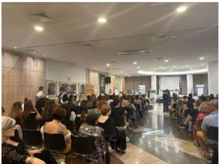
Sklaidos renginys Graikijoje, IDEC, birželio 28 d..

Graikijos partneris IDEC surengė sklaidos renginį, į kurį susirinko 50 dalyvių, norinčių išsiaiškinti gyvybiškai svarbų 55 metų ir vyresnių asmenų verslumo vaidmenį ir pabrėžti esminius įgūdžius, reikalingus jų tobulėjimui. Susitikimo metu didelis dėmesys buvo skirtas išskirtiniam „SENIOR+“ projekto indėliui ir rezultatams pristatyti, pabrėžiant jo pridėtinę vertę skatinant ir remiant senjorų verslumą. Renginys buvo platforma, skirta pabrėžti sėkmės istorijas, dalytis svarbiomis įžvalgomis ir aptarti paramos ir galimybių šiai demografinėi grupei didinimo strategijas.