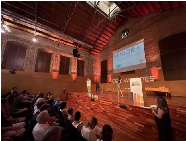
Skaidos renginys Ispanijoje, Asociación Con Valores, birželio 27 d.

Ispanijos partneris „Asociación Con Valores” organizavo sklaidos renginį birželio 27 d. nuo 18:00 iki 21:00. Renginyje "SENIOR+" dalyvavo įvairių profesijų atstovai, tarp jų - pradantieji verslininkai iš migrantų šeimų, kurie vėliau gyvenime susiduria su dideliais verslo plėtros iššūkiais. Pagal profesinę patirtį dalyviai buvo įvairūs - nuo tų, kurie tik pradeda savo verslą, iki tų, kurie turi kelerių metų patirtį. "Con Valores" pavyko pritraukti nemažą skaičių žmonių - net 103 dalyvius!