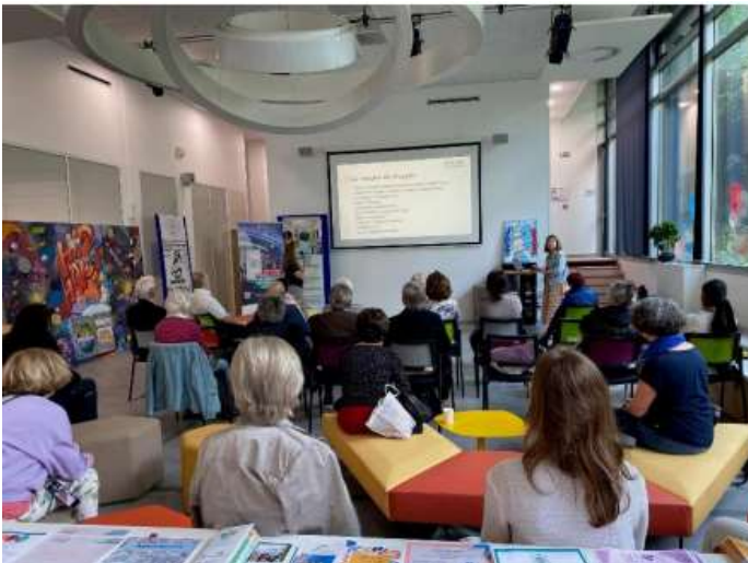
Sklaidos renginys Prancūzijoje, E-seniors, birželio 20 d.

matomumą ir skatinant tvarumą. Kai kurie partneriai pasirinko asmeninius renginius, o kiti pasirinko juos vesti internetu.